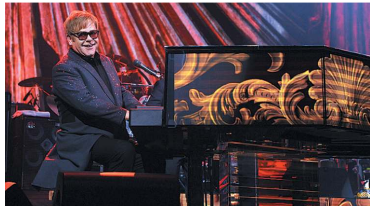
A trajetória de Elton foi apresentada no filme Rocketman, de 2019

Essa apresentação servirá com prelúdio para o documentário original da Disney, Goodbye Yellow Brick Road: The Final Elton John Performances and The Years That Made His Legend.